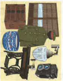
「かんたん出張買取」出張査定無料。常陸太田市下利員町の買取専門店

1000円。契約金1000円(半年更新)。販売手数料はなし。作品を作っても、売相場がない。そんな人のためのスペースです」と同店。同店 ☎ 0294-72-0401。