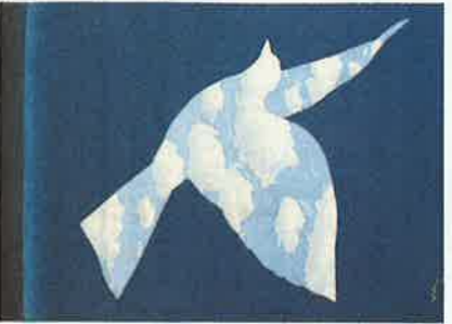
《空の鳥》 1967年、油彩、140x140cm 東京国立新美術館蔵

ペルギーの国民的画家で20世紀美術を代表する芸術家のル・ヴァグット(1898-1967)の展覧会「スグジット」が6月29日まで東京国立新美術館で開催されている。立新美術館で開かれている。国内では13年ぶりの本格的な大回顧展「ルギト王立美術館」でスグット展招待券を5組10人にプレゼント。応募方法は6月上旬。